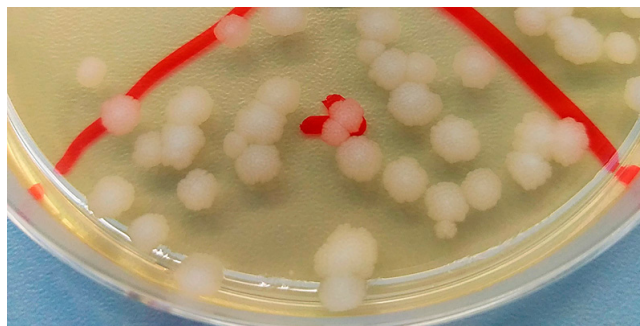
Rycina 1. Wzrost glonów Prototheca na podłożu Sabourauda

Głony z rodzaju Prototheca nie wymagają specjalnych podłoży; gdy badany materiał nie jest mocno zanieczyszczony, nie zawiera dużej liczby innych drobnoustrojów. Algi z rodzaju Prototheca dobrze wzrastają na podłożu agarowym z krwią czy też na podłożu Sabourauda z dekstrozą. Przy dodatku aktidionu, czyli cykloheksamidu produkowanego przez promieniowca Streptomyces griseus , do podłoża Sabourauda wzrost tych mikroorganizmów zostanie zahamowany. Wzrost hamuje także tetracyklina, ketokonazol, amfoterycyna oraz temperatura powyżej 40°C. W sytuacji gdy próbki materiału są zanieczyszczone i mogą zawierać dużą ilość innych mikroorganizmów (np. próbki wody ze strumieni, ścieków czy gleby), w celu zminimalizowania wzrostu bakterii można użyć chloramfenikol w stężeniu 100 mg/l. Stosuje się także wybiórcze podłoża: PIM, czyli Prototheca Isolation Medium , zawierające połączenie flucytozyny i wodorofalenu potasu, oraz PEM, czyli Prototheca Enrichment Medium [4]. W zależności od gatunku wygląd kolonii jest różny. Głony z rodzaju Prototheca optymalnie rosną w temperaturze 25–37°C. Na podłożu agar z krwią już po 24 godzinach inkubacji w temperaturze 37°C glony te zaczynają wzrastać, tworząc niewielkie białoszare bądź białe kolonie. Gdy glony wysieje się na podłożu Sabourauda z dodatkiem chloramfenikolu i przedłuży dwukrotnie czas inkubacji, wyrosnięte kolonie są większe, białoszare, kremowe bądź białe i w zależności od gatunku ich wygląd oraz wielkość są odmienne (ryc. 1).