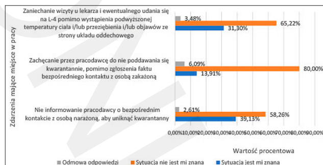
Rycina 2. Opinie respondentów na temat zdarzeń mających miejsce w zakładzie pracy

Pracownikom ochrony zdrowia przedstawiono również przykłady 3 zdarzeń i zapytano, czy miały miejsce w ich miejscu pracy (ryc. 2).